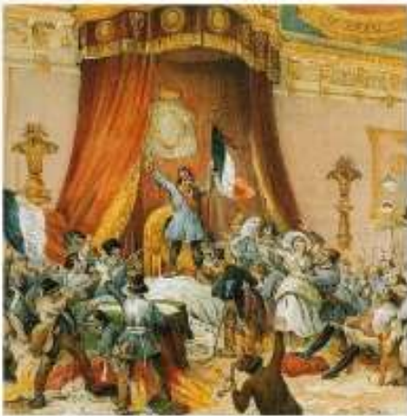
Declanșarea Revoluției de la 1848 în Franța