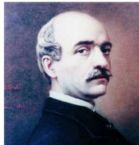
Vasile Alecsandri (1821-1859)