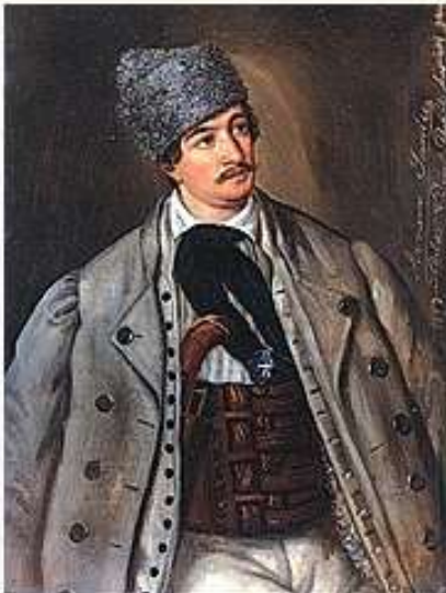
Avram Iancu, pictură de Barbu Ișcovescu.

Avram Iancu (1824-1872), a fost un avocat transilvănean și revoluționar român pașoptist, care a jucat un rol important în Revoluția de la 1848 din Transilvania. A fost conducătorul de fapt al Țării Moților în anul 1849, comandând armata românilor transilvăneni, în alianță cu armata austriacă, împotriva trupelor revoluționare ungare aflate sub conducerea lui Lajos Kossuth.