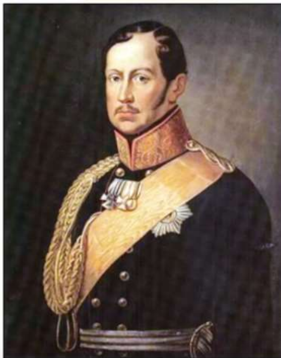
FREDERIC WILHELM III