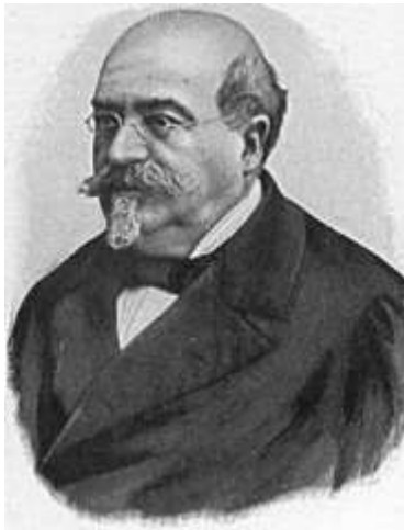
Mihail Kogălniceanu (1817–1891)

În Bucovina , Mihail Kogălniceanu redactează în august 1848 Dorințele partidei naționale în Moldova care prevedea regim liberal, reformă agrară cu despăgubire, unirea Țării Românești cu Moldova.