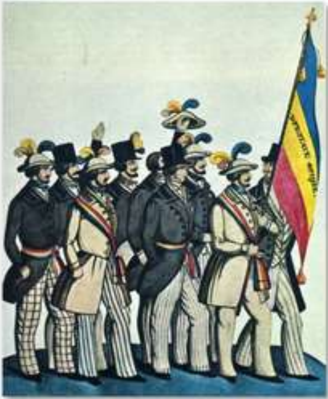
C. Revoluționari români de la 1848 purtând drapelul tricolor pe care scrie „Dreptate, frăție”

Revoluția de la 1848 a fost condusă de boierimea liberală și intelectuali.