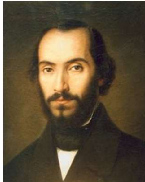
Nicolae Bălcescu (1819– 1852)

Unul dintre cei mai de seama istorici romani, a fost un participant activ si unul dintre liderii miscarii revolutionare din Țara Romaneasca.