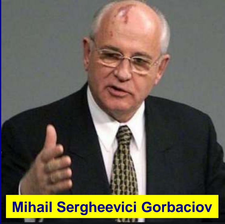
Mihail Sergheevici Gorbaciov