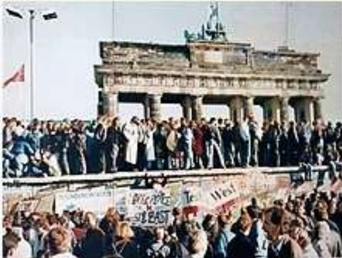
Căderea Zidului Berlinului în noiembrie 1989.