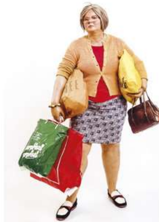
Tânăra la cumpărături, sculptură hiperrealistă de Duane Hanson, 1973

Obezitatea sugerată nu este nici ea întâmplătoare, fiind o caracteristică a unei părți importante a populației americane afectate de sedentarism și consum alimentar excesiv. Ce este societatea de consum, consecințele unui asemenea model de dezvoltare economică asupra vieții oamenilor, cât și alte lucruri despre economia lumii postbelice poți afla din lecție.